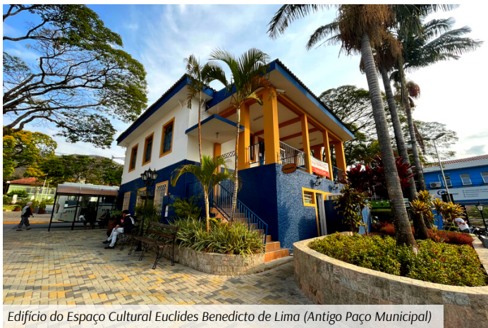
Edifício do Espaço Cultural Euclides Benedicto de Lima (Antigo Paço Municipal)