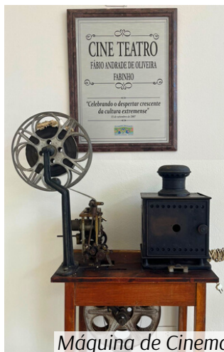
Máquina de Cinema