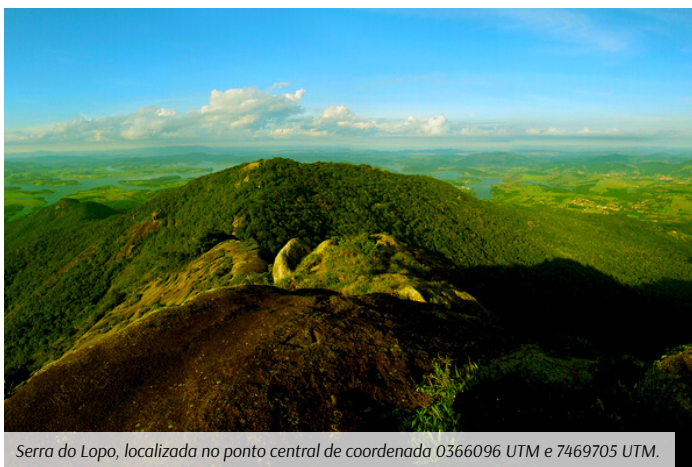
Serra do Lopo, localizada no ponto central de coordenada 0366096 UTM e 7469705 UTM.