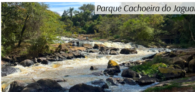
Parque Cachoeira do Jaguari

Para Aloísio Magalhães, ex-presidente do Iphan (Instituto do Patrimônio Histórico e Artístico Nacional), falar sobre preservação do patrimônio é: