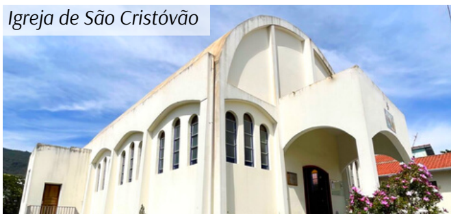
Igreja de São Cristóvão