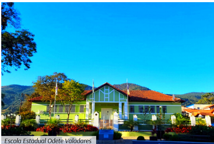
Escola Estadual Odete Valadares